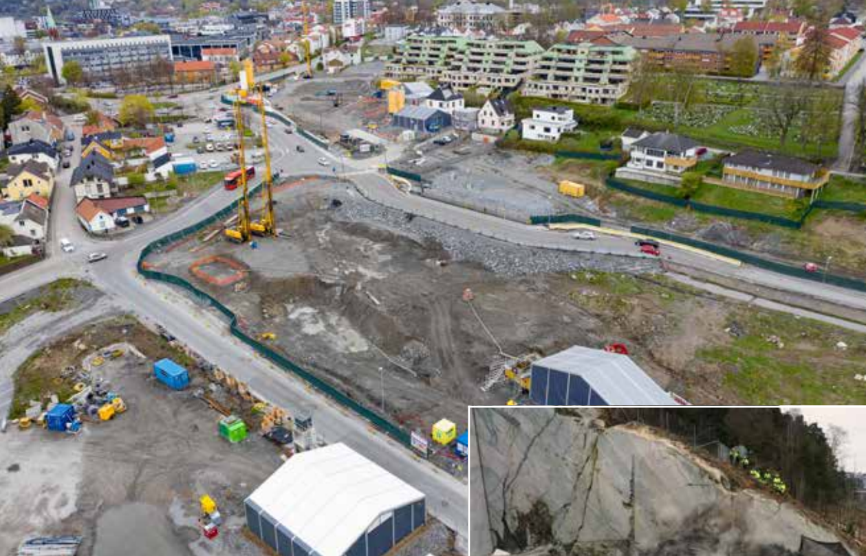
KREVENDE OMRÅDE: Dagssonen fra Kransen og sørover.