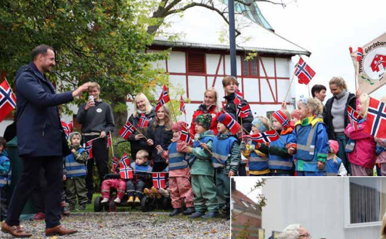
JUBEL: Da kronprins Haakon ankom Galleri F15 på Alby ble han møtt av barnehagebarn som veivet entusiastisk med norske flagg.