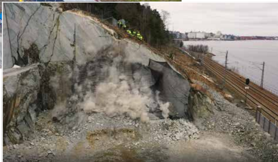
GJENNOMSLAG: 10. mars 2021 ble det gjennomslag i tunnelarbeidet i Sandbukta for det nye jernbanedobbeltsporet til Moss