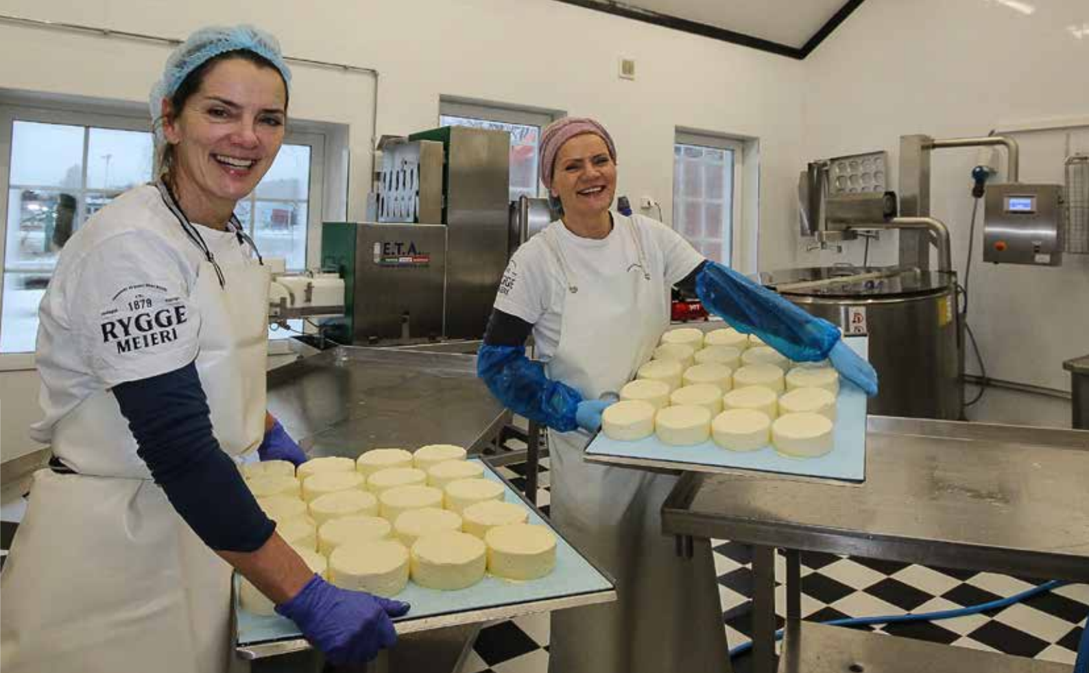
SUKSESS: Nå står Rygge Meieri offisielt bak Norges beste hvitmuggost (Bjølsund Brie) etter kåringen under NM i Oslo. Sølv Gammelsrød og søster Nina Felle gledet seg til fortsettelsen.