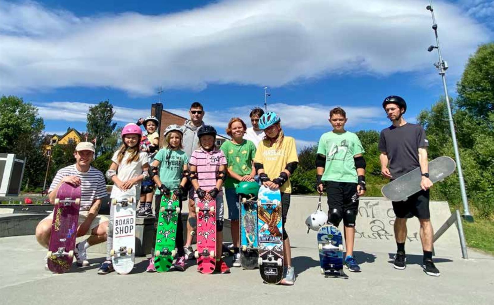
KNALLSTART: Moss Skateboardklubb var i gang med sitt første arrangement, et skateboardkurs for barn og unge, i samarbeid med sommerskolen.