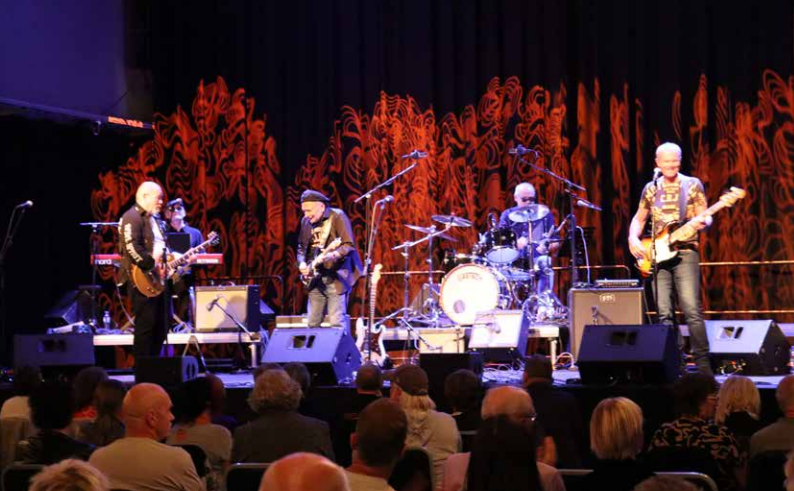
TRØKK: Moss Bluesklubb hadde en god 15-årsmarkering på Verket Scene.