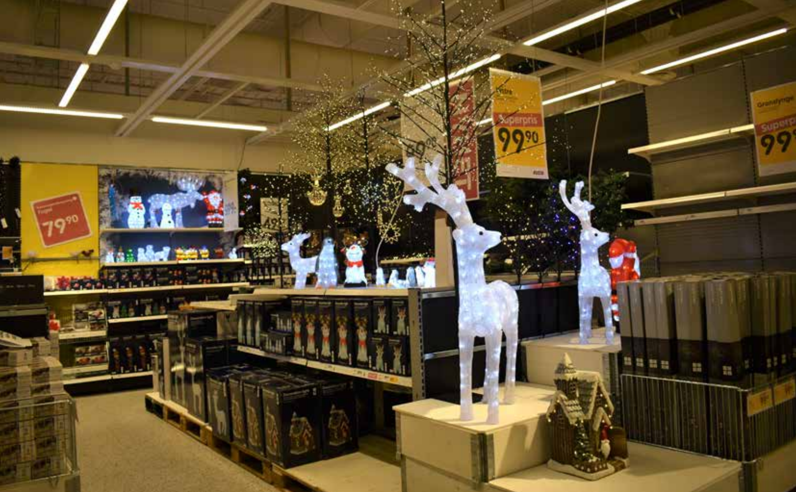
JULESTEMNING: Julepynten har startet sitt inntog i butikkene i Moss og snart er det tid til pepperkakebaking, trille marsipankulene og varme gløggen.