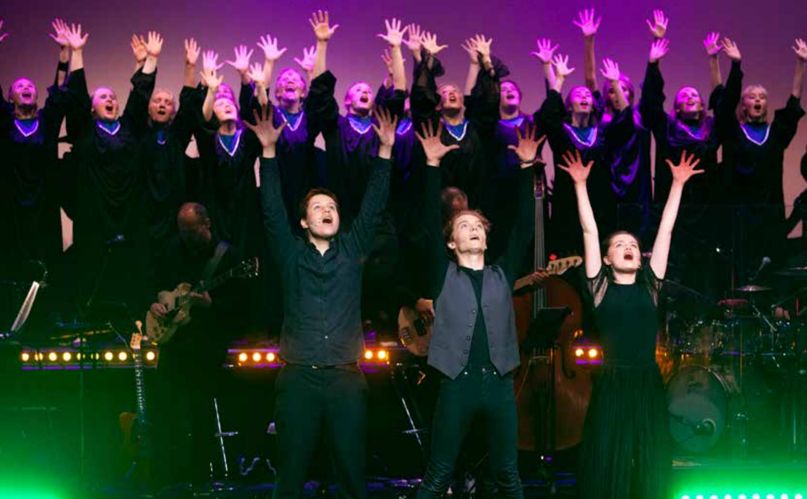
ENDELIG: Etter først en avlyst forestilling i fjor og en utsettelse i år kunne musikkteatergruppen A.P.P.L.A.U.S. spille for publikum igjen. Det satte både artister og publikum pris på.